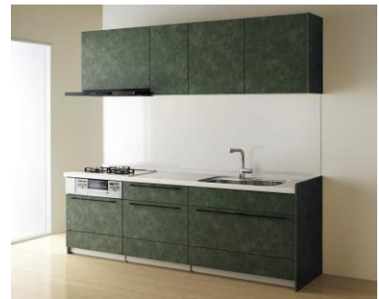
クリナップ「ステディア」 カラー：キールオリーブ

ホワイトやダークウッドなどの無難な色調にかわって、明るい色彩が人気を高めています。しかし、黒のキャビネットと目立つ色の備品を組み合わせるのもひとつの方法です。黒は実質的には中間色で、ほかのあらゆる色調とよく合うからです。既存の住宅では、明るい色のキッチンマットを敷くだけでもトレンド感がアップするでしょう。