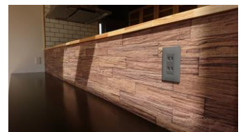
コンセントのあるキッチンカウンター (当社施工)

コロナ禍において、また、防災意識が高まっている昨今、日用品や食品の備蓄を増やす傾向がみられます。2つ目の冷凍庫や広いパントリー、別の部屋にある家具を活用したキッチン収納がトレンドになりつつあります。ガレージにチェストタイプの冷凍庫を置いたり、クローゼットを食品保存庫に転用したりすれば、リフォームや増築をしなくてもキッチン収納を広げることは可能です。