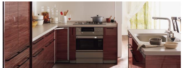
省スペースで料理しやすいビルトインオーブン

コロナ禍の影響もあり、自宅で料理をしたり、パンを焼いたりするようになってきている今、コンロ、オーブン、冷蔵庫などの使用頻度が高いキッチン製品をアップグレードする傾向がみられます。