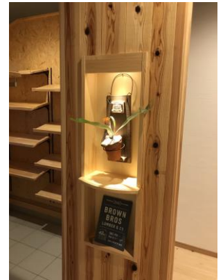
2017 当社施工 間接照明を効果的に

思い出や趣味、季節を感じるディスプレイ空間にしたり、鍵や時計などの小物置き場にしたり。