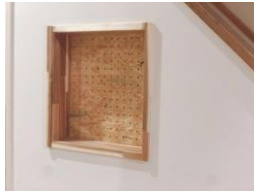
2021 当社施工 有孔ボードがアクセントに

玄関や廊下、リビングなどの壁をくぼませ、花や小物を飾るのに使われます。へこみ部分の壁紙を変えたり、タイルや木材などを張り込むことで、ニッチそのものがインテリアとしての役割を果たすことも。間接照明やスポットライトなどの照明と組み合わせることで、一気におしゃれな空間になります。